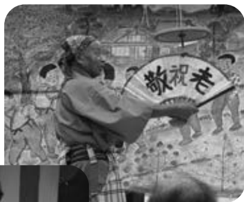
大道芸のコマ回し