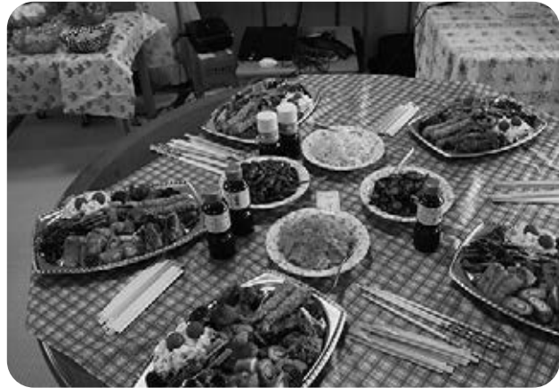
お皿いっぱいのおードブル