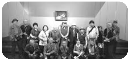
トリックアートにて