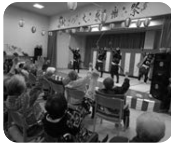
設楽武将ッ隊さま