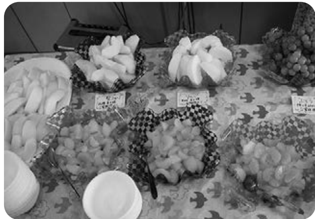
みんな大好きフルーツ盛り合わせ