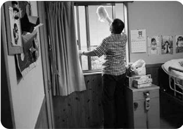
ガラスもびっかびか