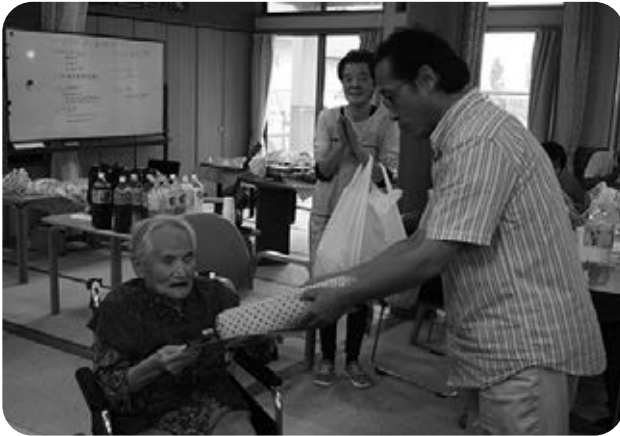
いつもありがとう