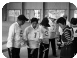
頑張る新野チーム