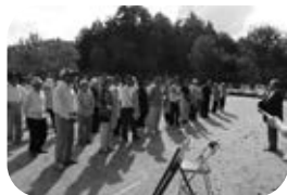
町ゲートボール開会式