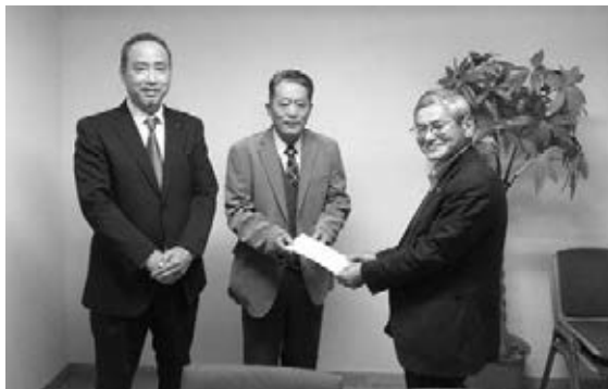
飯田下伊那理容師会様より 寄付金をいただきました。