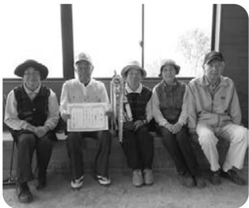
ゲートボールの皆さん

また、10月13日(土)には、町との共催で「第四十一回阿南町老人福祉祭り」が町民体育館で開催されました。お楽しみの歌謡ショー